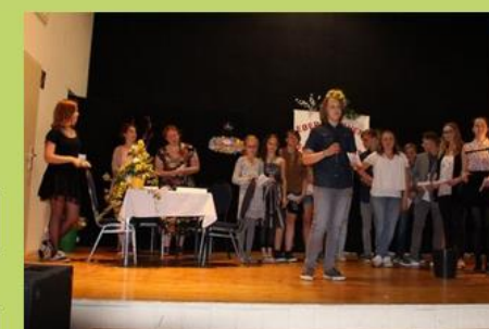
10 Jahre Schülerfirma

06.01.18 Tag der offenen Tür 15. bis 19.01.18 Skilager Durchgang 1 29.01. bis 02.02.18 Skilager Durchgang 2 12. bis 16.03.18 Woche der offenen Unternehmen 21.03.18 ADAC-Projekt 5. Klassen 09. bis 13.04.18 Fahrradlager