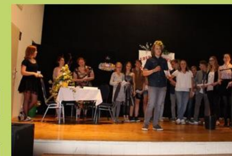
10 Jahre Schülerfirma