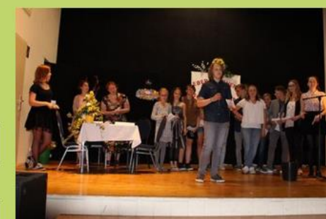
10 Jahre Schülerfirma